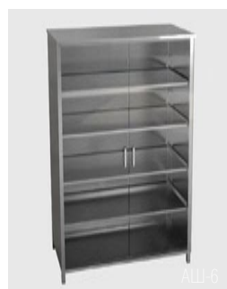
AШ-5 (1/2 стекло) AШ-6 (2/2 стекло)

Марка стали AISI 304. Изготовлен из профильной трубы 30 x 30 x 1,5 мм и листа толщиной 1 мм. Конструкция – сварная, сборно-разборная. Двери и боковые стенки – двойные. Петли дверей – осевые. Двери – металлические (стеклянные). Могут оснащаться замками. Стандартное количество полок – 3. Снабжен винтовыми опорами.