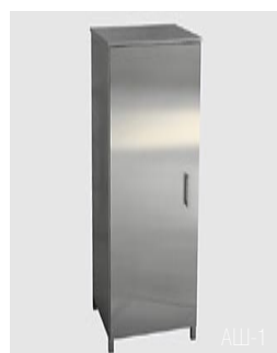
AШ-1 AШ-2 (2-х дверный) AШ-3 (1/2 стекло) AШ-4 (2/2 стекло)

Мы готовы предоставить Вам свой опыт, знания, производственный потенциал и высокий уровень работы для обеспечения Вашего успеха!