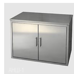
АНШ-1 (металлические дверцы) АНШ-2 (стеклянные дверцы)

Марка стали AISI 304. Изготовлен из профильной трубы 20 x 20 x 1,5 мм и листа толщиной 1 мм. Конструкция – сварная, сборно-разборная. Полки – вкладные, имеют бортик 20 мм. Конструкция снабжена винтовыми опорами. Укомплектованы пластиковыми колесными опорами на резиновом ходу диаметром 70 мм. Стандартное количество полок – 4 шт.