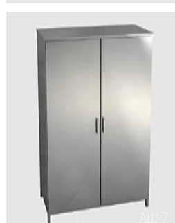
AШ-7 (2-х дверный) AШ-8 (4-х дверный)

Марка стали AISI 304. Изготовлен из профильной трубы 30 x 30 x 1,5 мм и листа толщиной 1 мм. Конструкция – сварная, сборно-разборная. Боковые стенки – двойные. Двери – металлические (стеклянные). Могут оснащаться замками. Стандартное количество полок – 4. Снабжен винтовыми опорами.